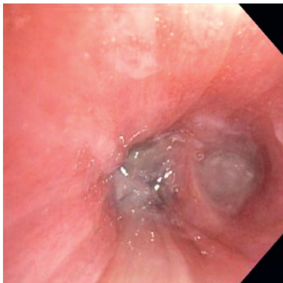
Figure 2: Cliché endoscopique du lobe inférieur droit obstrué par des sécrétions.

montrait plus qu'une obstruction non réversible modérée. La fraction expirée d'oxyde nitrique (FeNo) était à ce moment-là accrue, avec une valeur de 102 ppb (norme <25 ppb).