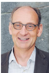
Arnold von Eckardstein

Vous trouverez l'éditorial relatif à cet article à la page 973 de ce numéro.